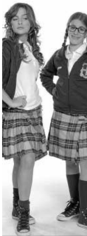
DISNEY. 'Patito feo'. 700.000 espect., 5%. 100.000 en Andalucía