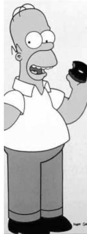
A. NEOX. 'Los Simpson'. 400.000 espect., 3,5%. 50.000 en Andalucía

nen las cuotas de las principales cadenas. Las ediciones del Telediario, verdaderos ritos en miles de hogares, aguantan entre lo más visto de cada día.