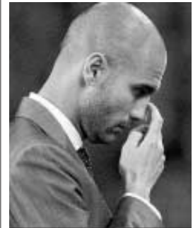
Guardiola, entrenador del Barça.

A nivel nacional la TDT temática tiene un 17% y La 1 ostenta el liderazgo por quinto mes, con un 15,7 con bastante diferencia por ahora con Telecinco, 14,6, y con descenso de Antena 3 al 11,5; mientras La Sexta aumenta su ventaja sobre Cuatro, con un 7,5 frente a 6,9. La 2 llega a mayo con un 3,1%.